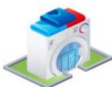
Магазины бытовой техники