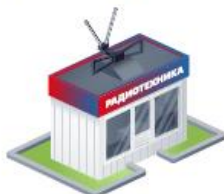
Магазины на рынке радиотехники