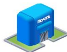
Отделения почтовой связи

Всю дополнительную необходимую информацию о телевизионном вещании в Алтайском крае Вы также можете получить по телефонам: 8 (3852) 50-64-98 – центр консультационной поддержки Алтайского филиала РТРС